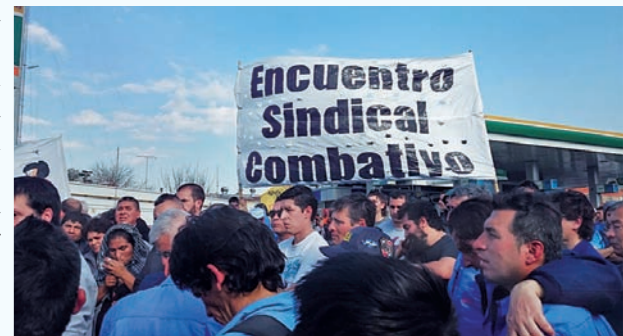
El Encuentro Sindical Combativo apoyando a los choferes de la línea 60