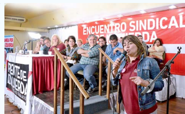
Encuentro sindical en el Bauen