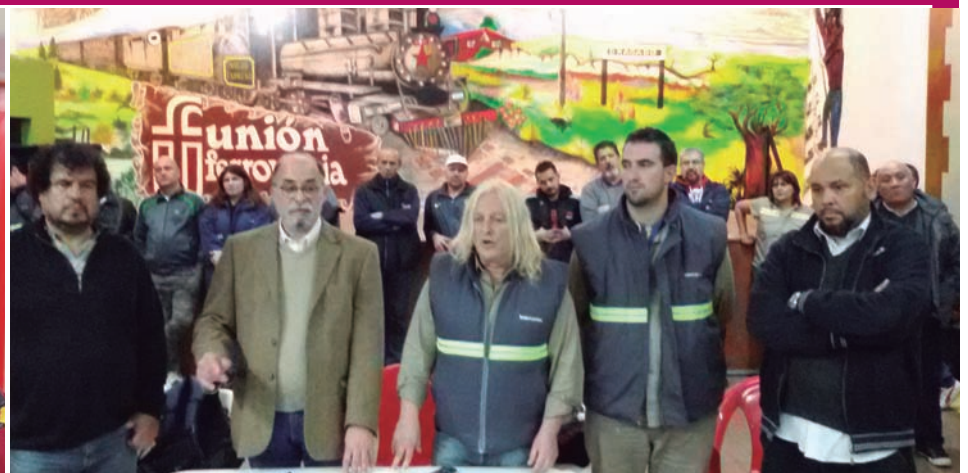
Vehículo de Sobrero incendiado y conferencia de prensa en la Seccional ferroviaria de Haedo donde se repudió el ataque