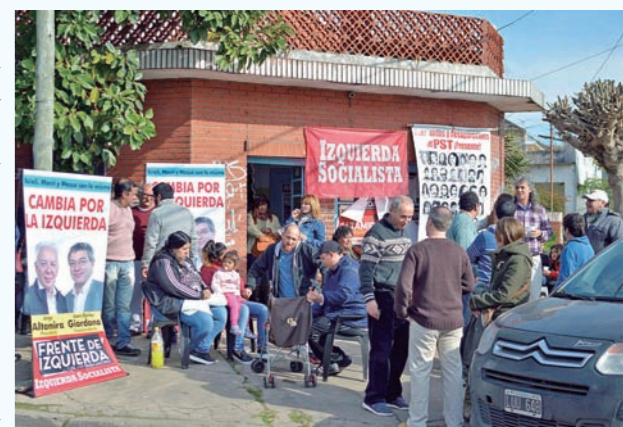
Inauguración de un local partidario en zona norte del Gran Buenos Aires