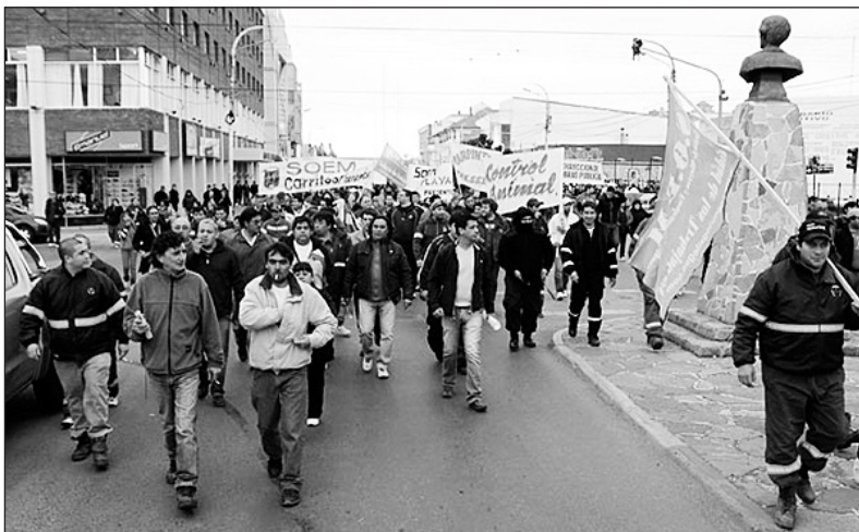
En la provincia de los K se rebajan los salarios

El sostenido reclamo de los municipales sigue generando enormes costos políticos para el kirchnerismo. Cuando fueron Scioli y Zannini a presentar la candidatura de Máximo Kirchner, tuvieron que hacer todo un operativo con la gendarmería para esconderse en una librería y desde ahí largar la campaña, casi escondidos. Al día siguiente renunció el intendente y asumió Grasso, amigo íntimo de Máximo. Este se comprometió a pagar los salarios adeudados, pero no a considerar la deuda del 15% de aumento que le debe el municipio desde enero. Si bien hubo negociaciones, las propuestas fueron pequeños aumentos de $400 a $500, lejos del 15% que les deben y, además, se hacían sobre la base de quitarles horas extras y otros beneficios. ¡Le daban poco y le sacaban de su mismo salario! Pese a que el secretario general intentó que se aprobara esa propuesta, las