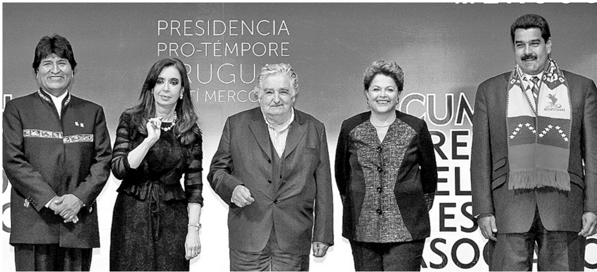
De izquierda a derecha: Evo Morales, Cristina Kirchner, José Mujica, Dilma Rousseff y Nicolás Maduro, los gobiernos del doble discurso

La reacción de todos los llamados “gobiernos progresistas”, sin excepción -Nicolás Maduro, Dilma Rousseff, Michelle Bachelet, Rafael Correa, Evo Morales, Cristina Kirchner- es el ajuste antipopular para proteger las ganancias del gran capital, con el objetivo, dicen, de “atraer inversiones”. La crisis actual revela que los años de grandes ingresos