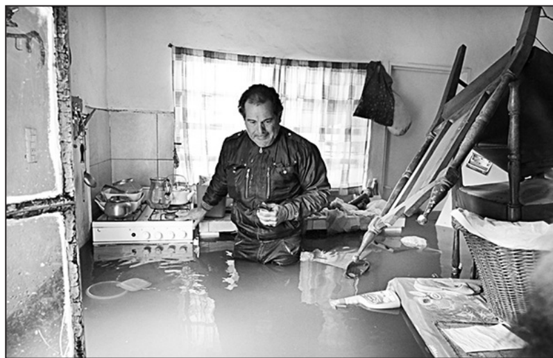
Miles lo han perdido todo. El gobierno es responsable

Como siempre, la única ayuda que existe es la que surge de la solidaridad obrera y popular. Organizaciones sindicales, estudiantiles y barriales se han puesto a la cabeza de la ayuda, tal es el caso de los Sutebas combativos o los ferroviarios del Sarmiento. Junto con estas iniciativas, desde Izquierda Socialista y el Frente de Izquierda nos ponemos a disposición de los damnificados, ofreciendo nuestros locales como centros de solidaridad y realizando colectas en lugares de trabajo y estudio. Pero a la vez proponemos que todo eso se transforme en organización, llamando a realizar asambleas de los vecinos inundados, que reclamen soluciones efectivas a los gobiernos municipales, provincial y nacional, como ya empezó a ocurrir en Luján.