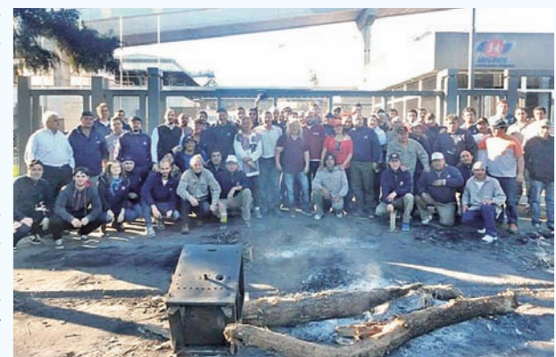
Dando el apoyo a los trabajadores aceiteros de Rosario